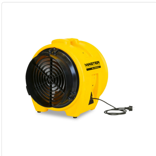
Master BL 8800 – Professionelle Gebläse