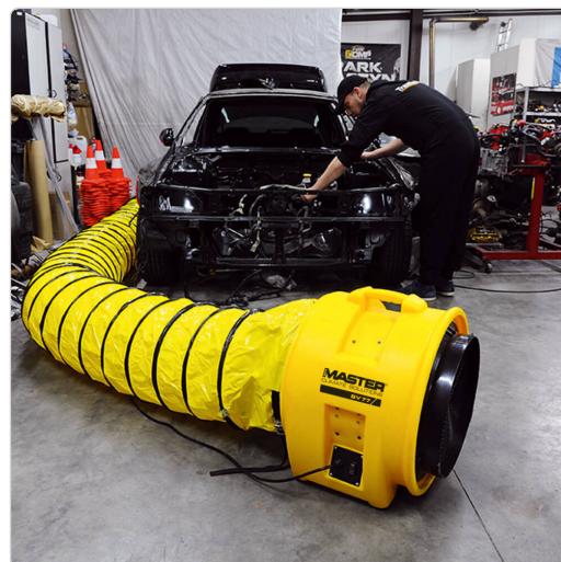
Master BL 8800 Garage Werkstatt